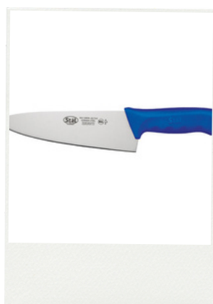
25 cm Sku: KWP-100U

Hoja de acero alemán X50 Cr MoV15 afilada como una navaja. Los mangos de polipropileno antimanchas y antideslizantes de diseño ergonómico ofrecen una comodidad excepcional y reducen la fatiga de los brazos y las manos., además de proteger los dedos. Fácil mantenimiento de bordes y afilado rápido. Certificación NSF.