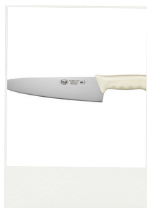
25 cm Sku: KWP-100