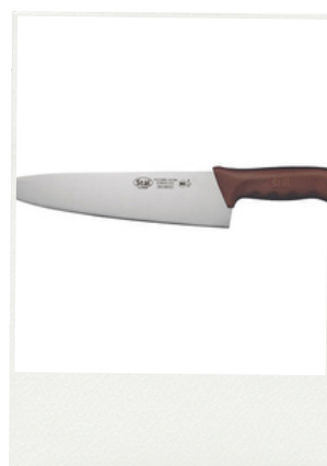
25 cm Sku: KWP-100N