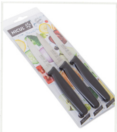
Pack 3 Cuchillos Legumbres