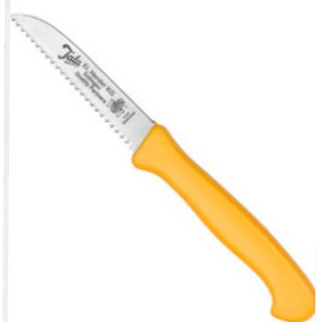
Cuchillo Pelador Con Sierra