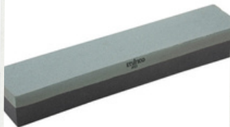
Piedra Grano Fino/Medio

Acero de carburo grueso para afilar Varillas de cerámica para afilar