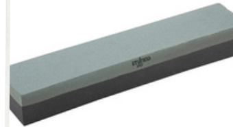
Piedra Grano Fino/Medio