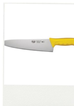
25 cm Sku: KWP-100Y