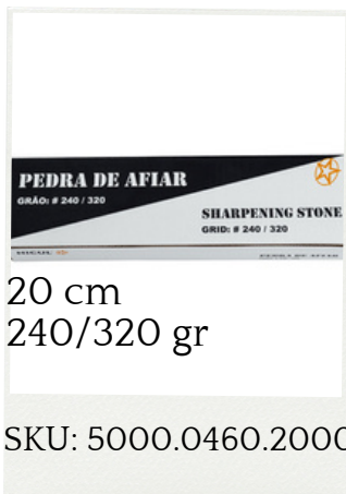
Piedra de Afilar