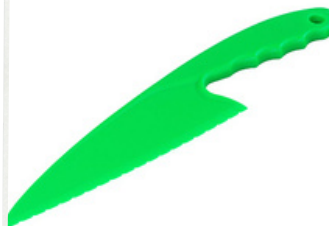
Cuchillo Plástico para Lechuga